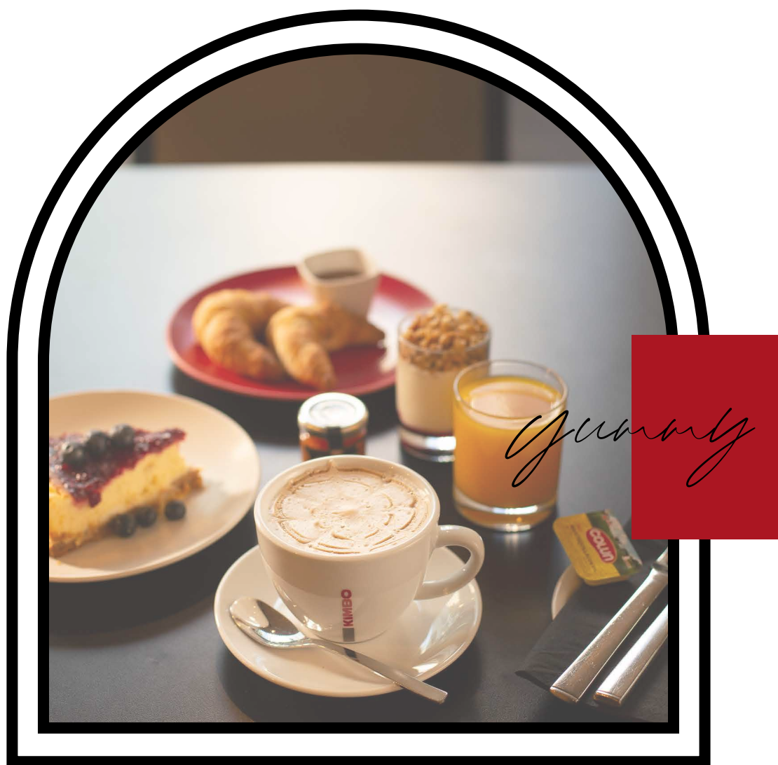
"Sugerencia dulce" & "Yogurt con frutos rojos y granola" una referencia.