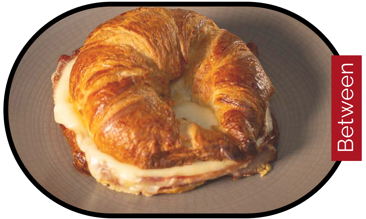
Referencia a un "Bonjour"

Fried or scrambled eggs, buttery cheese, bacon and filled mini donuts served with a warm baguette or your choice of toast